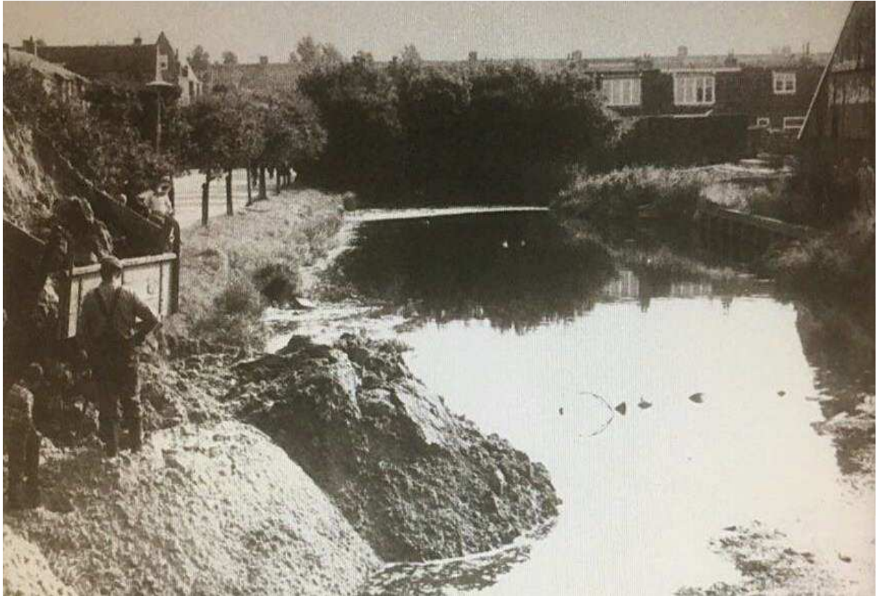
↑ De Molenvaart annex Fabrieksgracht wordt volgestort. Op de achtergrond de Ruyghweg.