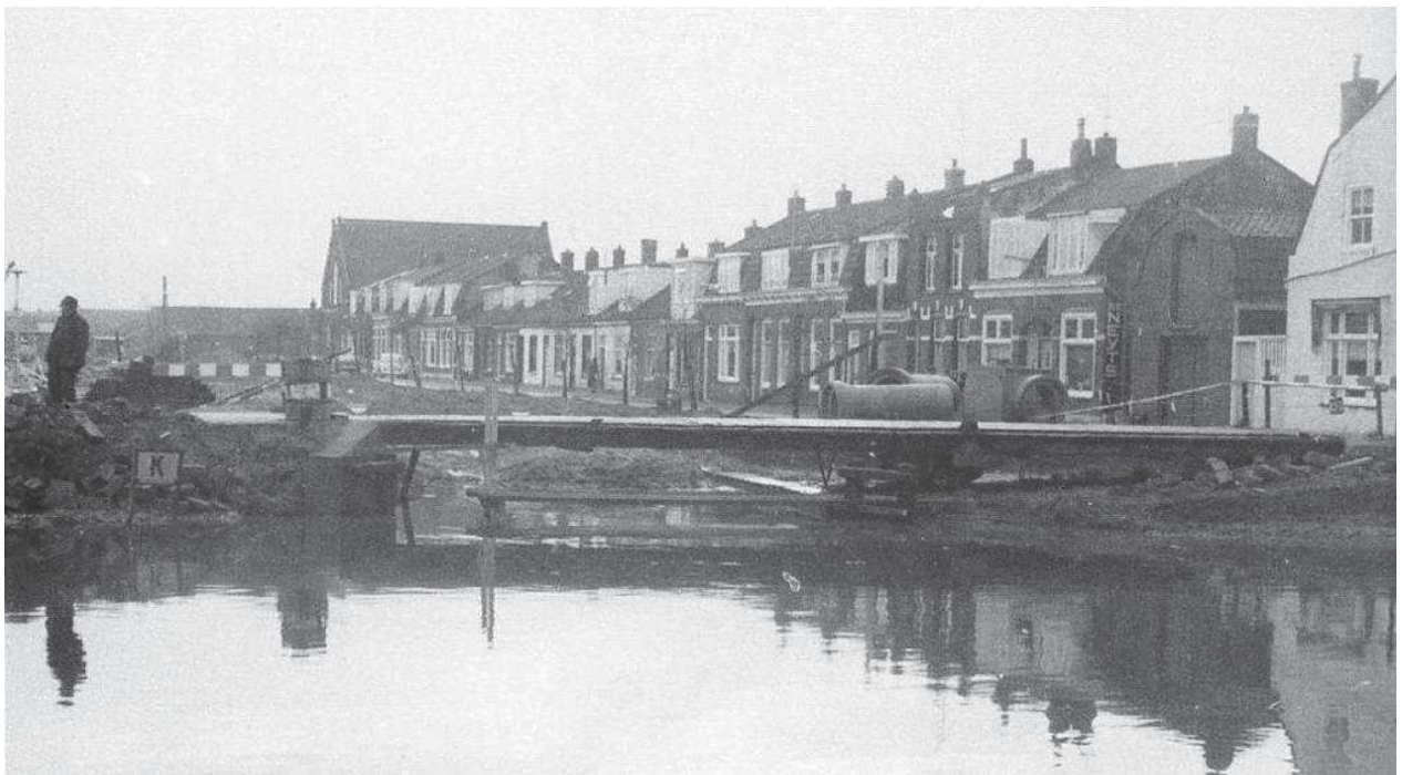
↑ Ook de Steengracht moest er aan geloven en werd gedempt. Op de voorgrond het water van de Spoorgracht.